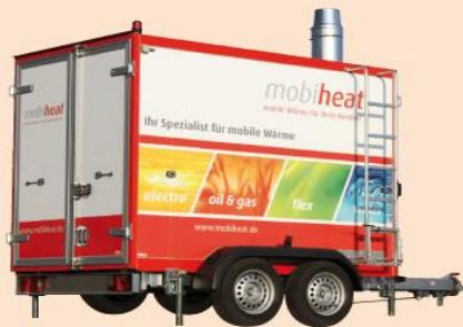
Abb. Heizmobil 300 kW Leistung

mobiheat garantiert mit mobilen Heizzentralen für eine zuverlässige Wärmeversorgung: